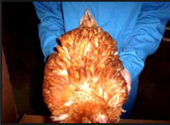
Fuldfjeret brun høne