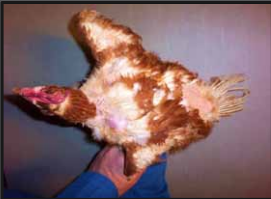
Mellempillet brun høne