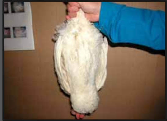
Hvid høne med spor af begyndende fjerpilning