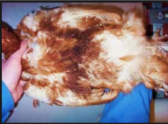
Let pillet brun høne