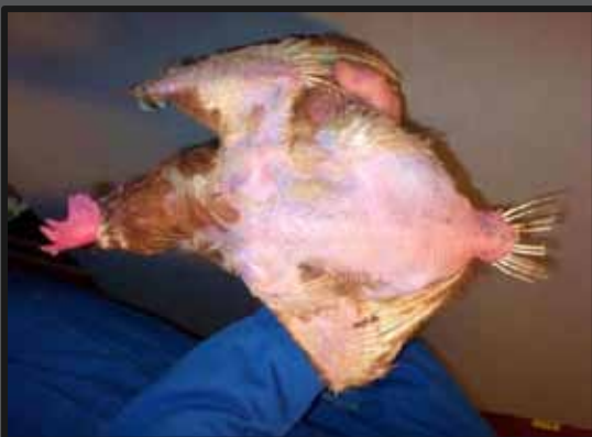
Svært pillet brun høne