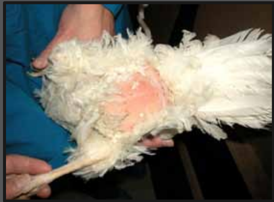
Hvid høne pillet ved gumpen