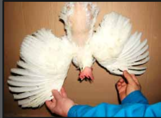
Hvid høne pillet på ryg