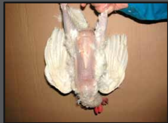
Hvid høne svært pillet på mave og lår